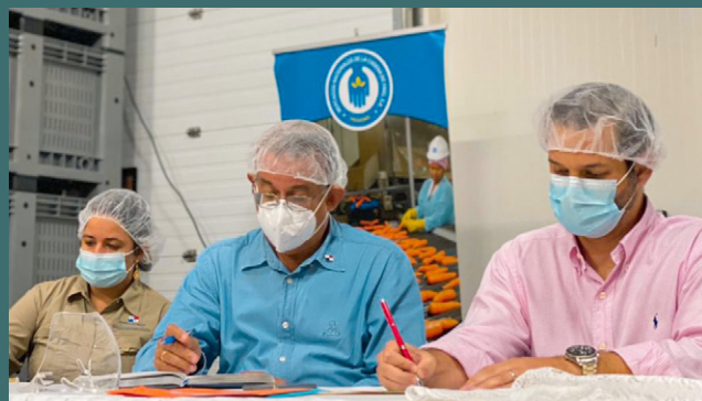
S.E. Augusto Valderrama, Ministro del MIDA y S.E. Ramón Martínez reunidos con los productores sobre la defensa del TPC entre Panamá y los Estados Unidos.

En el caso de la carne de pollo es evidente que el comercio ha venido ocurriendo en una sola vía, en favor de los Estados Unidos y bajo alto