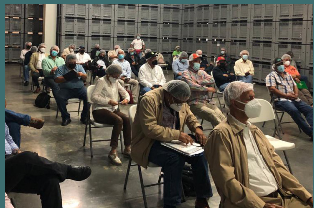
En la reunión participaron representantes de ANAVIP, ANAPOR, COOLECHE, APROGALPA, ACPTA y la Cámara de Comercio de Chiriquí.

riesgo de perjudicar a la industria panameña, lo que se explica por la dificultad de procedimientos para el reconocimiento de la equivalencia sanitaria por parte de los Estados Unidos, la asimetría en las dimensiones productivas, el diferenciado patrón de consumo de los Estados Unidos y Panamá, los altos precios internos de la carne blanca en ese país y los bajos precios de exportación del muslo encuentro de pollo.